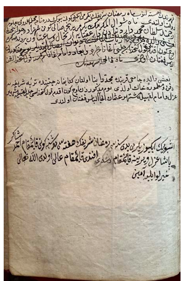
Order No MSS_163

All prices are net prices in Euro (without VAT) and exclusive of postage